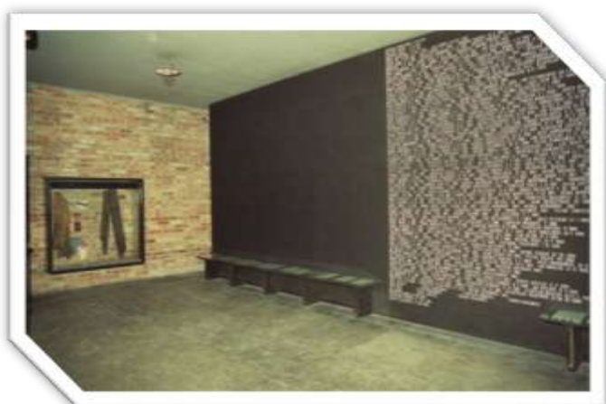
Tablica straconych na stokach Cytadeli Warszawskiej umieszczona w tzw. "korytarzu śmierci"

Zlokalizowane na terenie twierdzy zbudowanej przez cara Mikołaja I w latach 1832-1834 po stłumieniu powstania listopadowego. Cytadela obsadzona silnym garnizonem, wyposażona w kilkaset armat, wzmocniona w latach późniejszych systemem 5 fortów oraz przyczółkiem mostowym na Pradze, miała zwiększyć kontrolę władz rosyjskich nad buntowniczą Warszawą; jednocześnie stała się kolejnym ogniwem w łańcuchu twierdz chroniących zachodnie rubieże Imperium Romanowów. W jej skład weszły m.in. istniejące od 1725 r. dawne koszary gwardii koronnej pieszej trzech ostatnich władców niepodległej Rzeczypospolitej, po 1815 r. przemianowane przez Rosjan na koszary Aleksandrowskie.