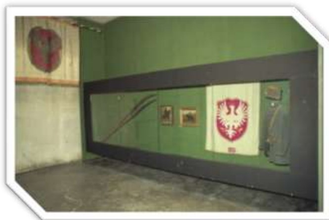
Fragment ekspozycji poświęcony Powstaniu Styczniowemu

Muzeum X Pawilonu Cytadeli Warszawskiej to jedno z najważniejszych muzeów martyrologicznych na ziemiach polskich.