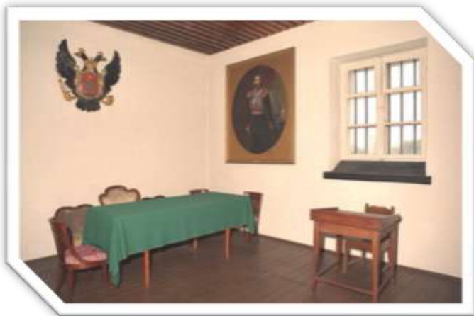
Sala Komisji Śledczej

W latach okupacji niemieckiej 1939-1945 Cytadela, obsadzona oddziałami Wehrmachtu i SS, stanowiła silny punkt oparcia władz niemieckich.