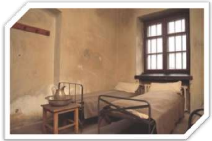
Cela zbiorowa w X Pawilonie

Po odzyskaniu niepodległości w 1918 r., kiedy Cytadelę przejęło wojsko polskie, w X Pawilonie mieścił się początkowo areszt dla osób podlegających sądownictwu wojskowemu, później zaś przeznaczono go na mieszkania dla wojskowych z miejscowego garnizonu, a we wschodnim skrzydle wyeksponowano pamiątki po więźniach.