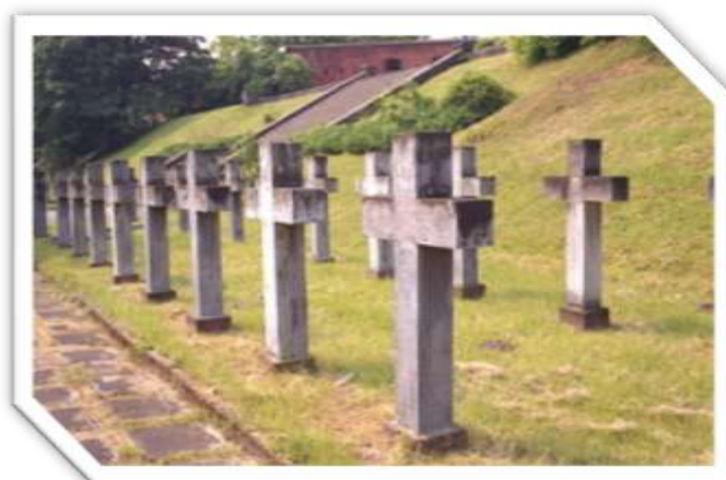
Symboliczny cmentarz straconych na stokach Cytadeli Warszawskiej

Również okupanci niemieccy w latach 1915-1918 wykorzystywali Cytadelę do celów wojskowych; X Pawilon pełnił wówczas także funkcję więzienną, a na stokach odbywały się egzekucje.