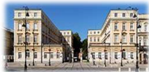
Pałac Czapskich widziany z Krakowskiego Przedmieścia

Miejsce upamiętnione przez Adama Mickiewicza w „Dziadach” cz. III, scena VII - Salon Warszawski.