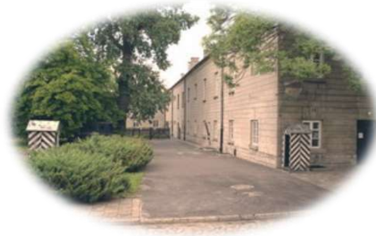
Wejście na dziedziniec X Pawilonu